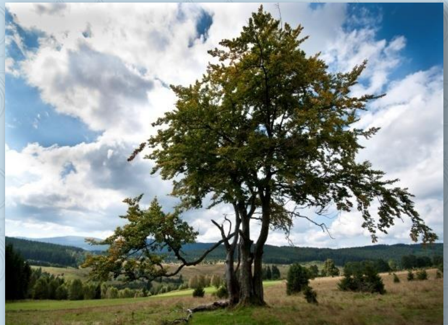
Staré stromy na Zhůří

Dáme se po ní vpravo a naštěstí hned za restaurací, která je asi 100 m daleko, zatočíme vlevo. Stále jedeme po trase 2093 až do Javorné. Vystoupáme do vsi a pak nahoru ke kostelu. Za ním je parkoviště a rozcestníky. Pojedeme rovně a teď už nás čeká 4 km stoupání, naštěstí ne moc prudkého po šotolinové cestě na Keple. Až přijedeme na silnici, odbočíme doprava na trasu č. 38 a dojedeme do místa zvaného Stará Huť.