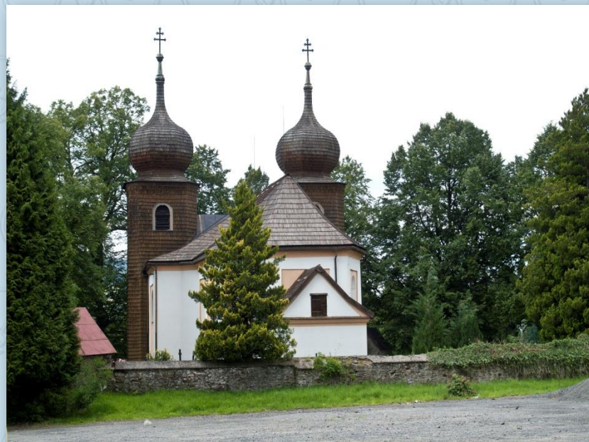
Kostel v Javorné